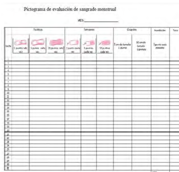
Figura 1. Pictograma de evaluación de sangrado menstrual

A pacientes y controles se les solicitó consentimiento informado y se les realizó una entrevista donde se recabaron datos patronímicos, datos clínicos y se les solicitó que completaran el pictograma de evaluación de sangrado menstrual (PESM) (Figura 1).